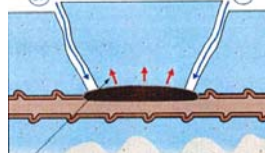
鉄筋腐食によるかぶりの剥落

RCおよびPCなどのコンクリート製の道路橋を中心として、要求性能、劣化の実体、劣化要因とメカニズムについて述べる。右の写真は、塩害劣化によりかぶりコンクリートが剥落し鉄筋が露出したRC道路橋床版や主桁の状況の一例である。大変深刻な状況にあることがわかる。