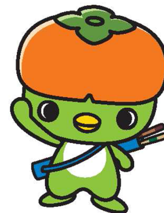
橋本市マスコットキャラクター はしぼう